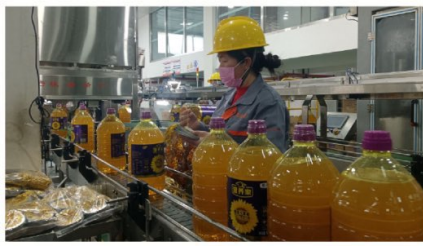
12月23日，位于昭化工业园区的中纺粮油(广元)有限公司灌装生产线正满负荷生产。该公司是中粮集团旗下以油料加工为主的重点企业，以粮油加工和销售为主营业务，销区覆盖四川、陕西、甘肃等地。目前，公司已全面完成年度目标任务。

雅拉德荣剑阁县项目开工暨首批种牛交付仪式在剑阁县举行。市委书记何树平出席，市委副书记、市长董里讲话，将帅事业集团董事长、董事长王德根致辞，市委副书记蔡邦银主持。